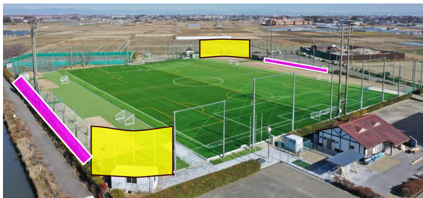
図 2： 掲示可能箇所（バックネット・金網フェンス）