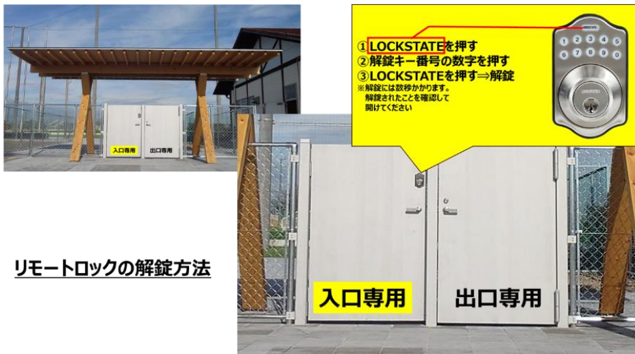
リモートロックの解錠方法