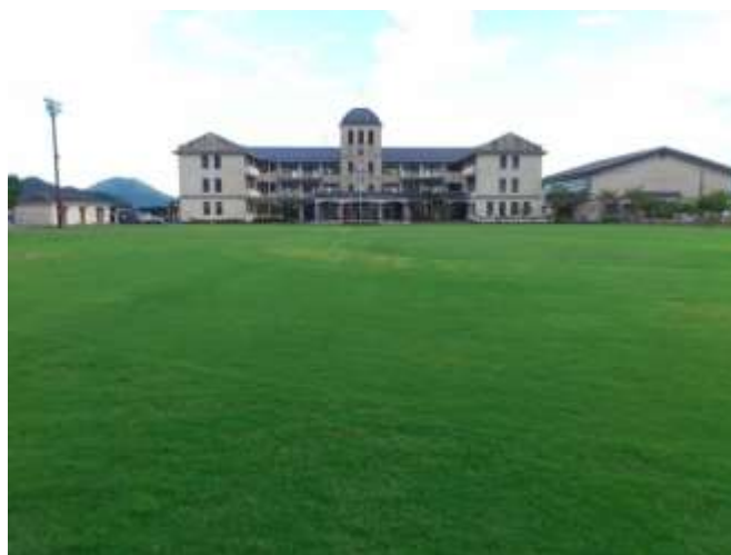
移植後約 3 ヶ月の芝生の模様 撮影日：2012 年 9 月 20 日