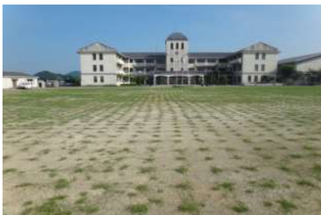
植付け 1 ヶ月後の模様 撮影日：2012 年 6 月 23 日