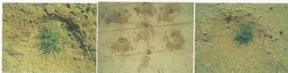
④踏みつけた後、周囲の土をポット苗の周りに戻す