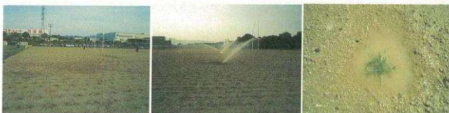
⑤移植当日はたっぷりと散水する