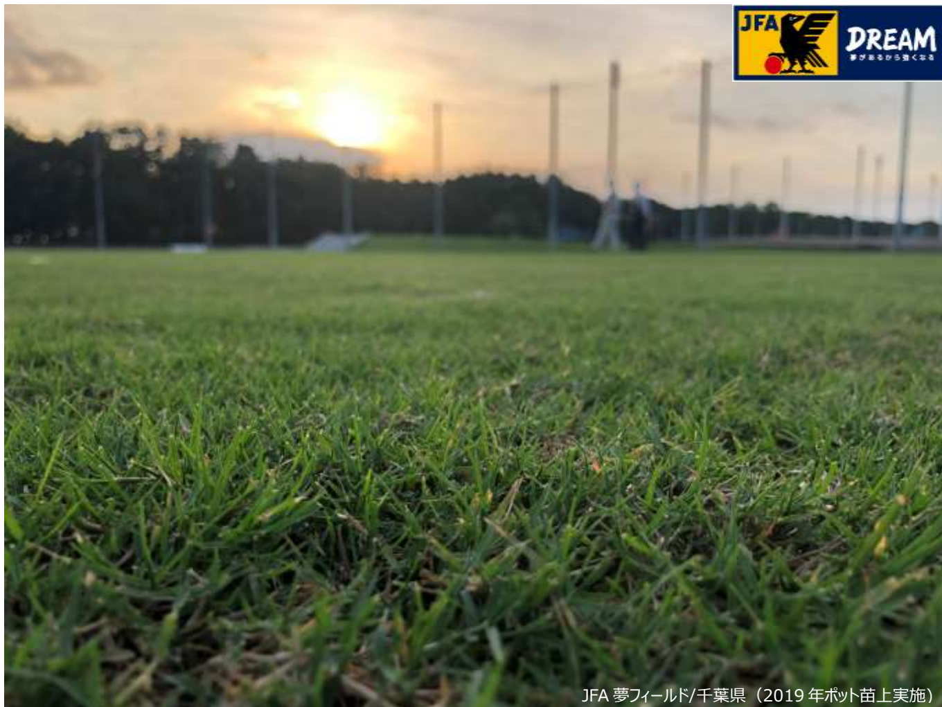
JFA 夢フィールド/千葉県 (2019 年ポット苗上実施)