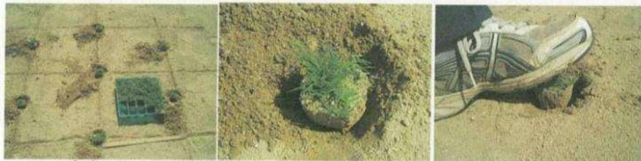
③ポット苗を1株ずつ穴に置いて、足でしっかりと踏みつける