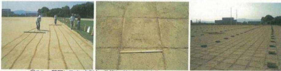
①50cm間隔にラインを引き、苗箱(25株)を配置する